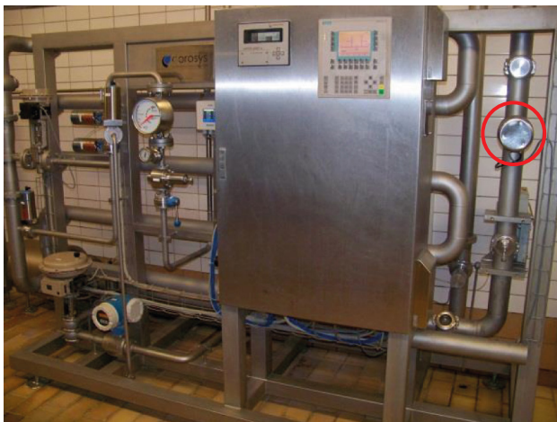
Beispiel einer Blendinganlage mit integriertem ColorPlus (Kreis)