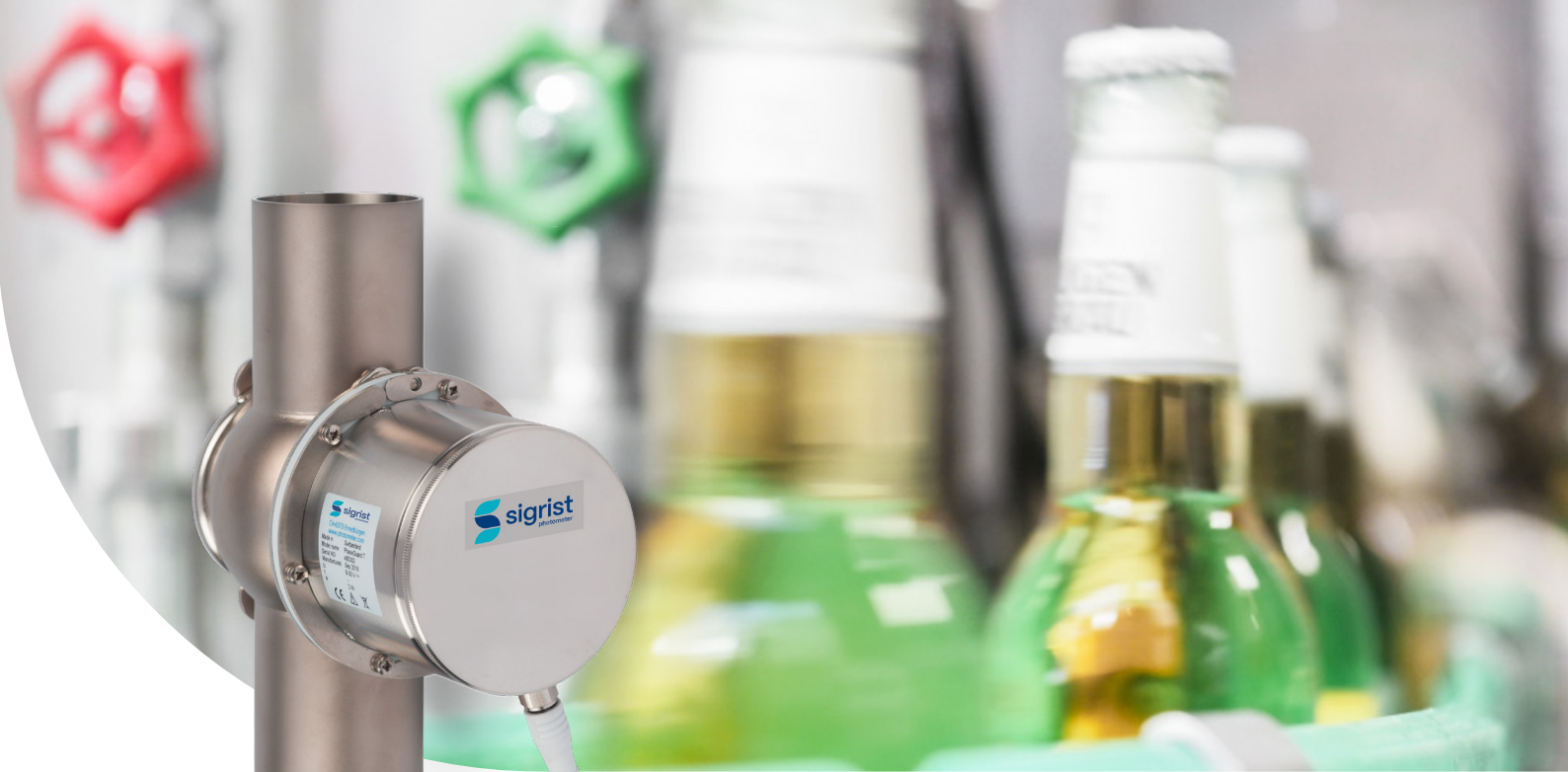
The PhaseGuard in Varivent housing