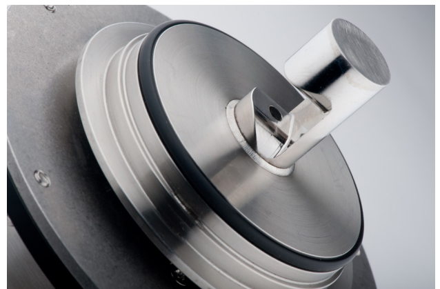
Sensorkopf PhaseGuard C