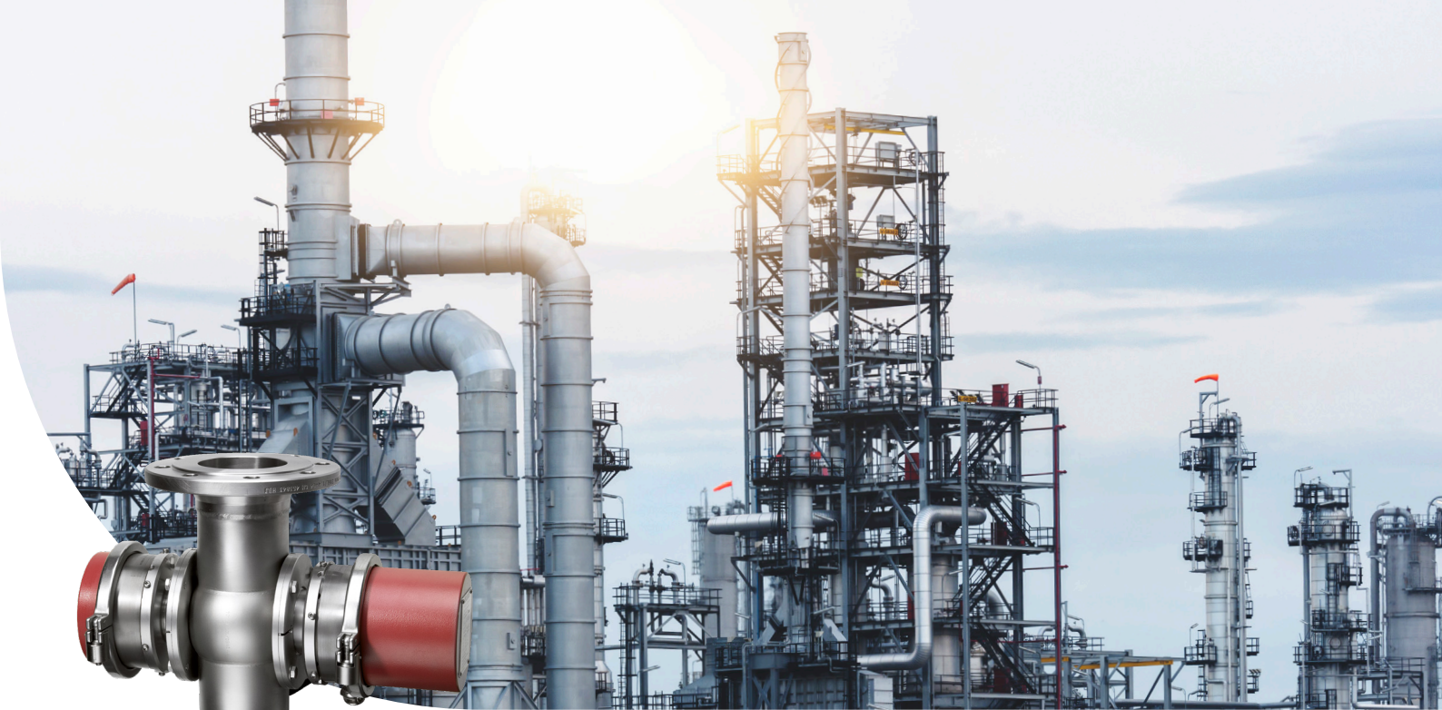
Das Color Plus Ex