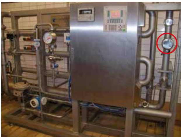
Beispiel einer Blendinganlage mit integriertem ColorPlus (Kreis)